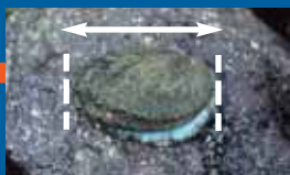
ORMEAU 9 CM

Pêche autorisée du 1 er septembre au 14 juin. Maxi 20 / personne / jour. Pêche sous-marine et utilisation d'un masque et /ou d'un tuba interdites.