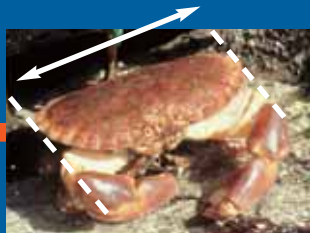
TOURTEAU 14 CM

CHAQUE BARRE ORANGE CORRESPOND À LA TAILLE AUTORISÉE.